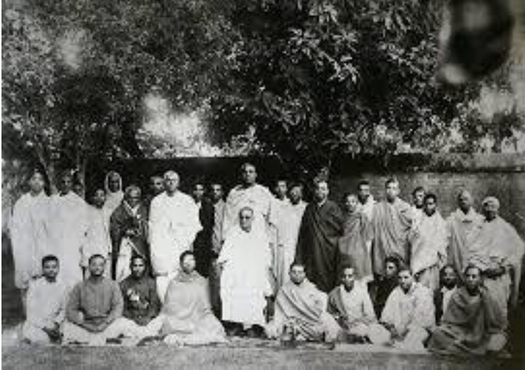
Sri Srila Bhakti Siddhanta Sarasvati Thakura und seine Schüler