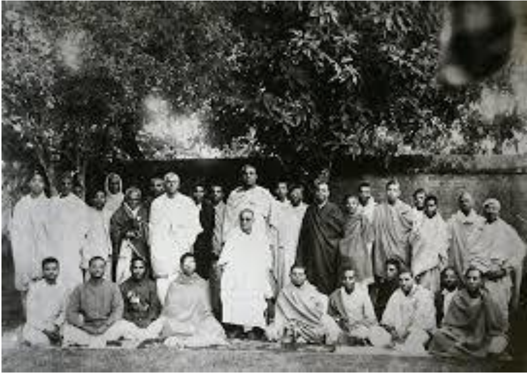
Sri Srila Bhakti Siddhanta Sarasvati Thakura und seine Schüler